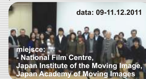
data: 09-11.12.2011 miejsce: - National Film Centre, Japan Institute of the Moving Image, Japan Academy of Moving Images

widownią o filmach tutorskich ponownie pojawił się wątek różnicy pomiędzy reportażem telewizyjnym i artystycznym filmem dokumentalnym. Widzów zainteresowały także tematy dotyczące polskiej historii najnowszej. Pytania o filmy warsztatowe najczęściej dotyczyły struktury montażowej. Pytano także o specyfikę współpracy ze studentami w poszczególnych miastach. Na zakończenie, podczas uroczystego wręczenia certyfikatów uczestnictwa w warsztatach, koszulek i płyt z gotowymi filmami, nie zabrakło wzruszających momentów. Japońscy studenci podkreślali, niekiedy ze łzami w oczach, jak ważne było dla nich to spotkanie z polskimi filmowcami.