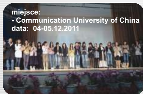
miejsce: - Communication University of China data: 04-05.12.2011

przybliżające historyczny kontekst niektórych filmów: stanu wojennego w Polsce i powstania „Pomarańczowej Alternatywy”, wydarzeń z 1968 roku i samospalenia Ryszarda Siwca. Studenci chińscy mimo późnej pory nie chcieli kończyć spotkania (dyskusja zakończyła się o 22.00) żywo reagowali pytaniami, polemikami i osobistymi komentarzami. Z kolei oficjalny pokaz części pekińskiej projektu, odbył się w uroczystej atmosferze, choć nie brakowało momentów zabawowych, jak wspólne zdjęcie wszystkich uczestników warsztatów w „podskoku”, czy rozdawanie koszulek z nadrukiem logo projektu. W publicznych wypowiedziach o filmie podkreślano decyzję twórców aby pokazać Pekin autentyczny, nie turystyczny. Właśnie to najbardziej podobało się chińskiej widowni.