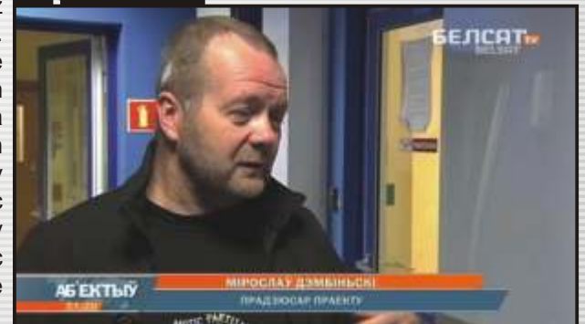
TV telewizja "Belsat"

Najważniejszym wymaganiem, stawianym autorom było uchwycenie sensu oraz pominięcie zbędnych drobiazgów. Należało opowiedzieć o mieście poprzez mieszkających tu ludzi. Na koniec powstało pytanie co może być przewodnim motywem. Postawiono na młodych ludzi uprawiających parkour. Pokonujący przeszkody, skacząc, robiąc salta i przeżuty przedstawiają w filmie Plac Zwycięstwa, Akademii Nauk, oraz Park Gorkiego.